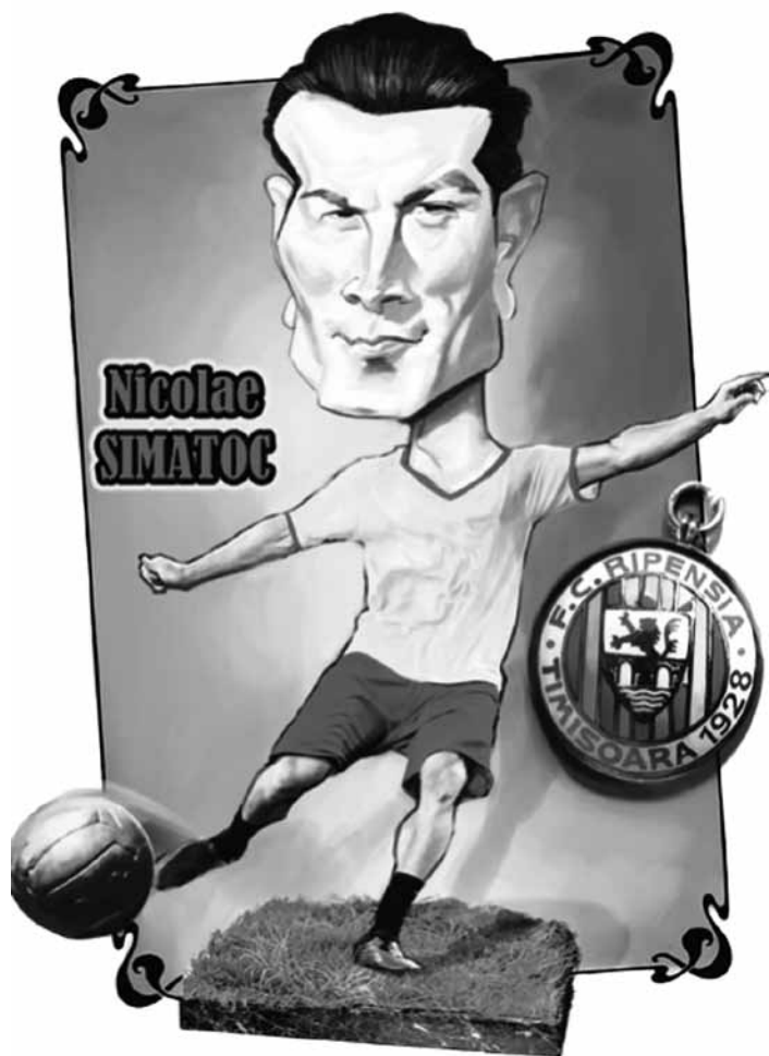
În ochii caricaturiștilor timișoreni, 2013.