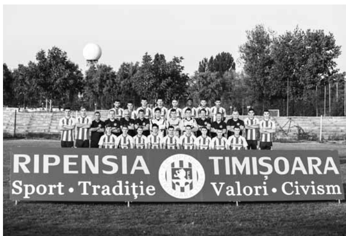
Ripensia Timișoara, 2014: 80 de ani după N. Simatoc.

prin performanțele internaționale, – redimensionează trecutul și prezentul fotbalistic al Banatului. Noua construcție a Ripensiei, concepută să fie una „pas cu pas”, fără arderea etapelor atât de necesare făuririi și dezvoltării unei asociații viguroase și trainice, este în măsură să devină purtătoarea visurilor sau speranțelor celor care păstrează în suflet acest nume.