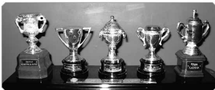
Replica celor Cinci Cupe, câștigate de N. Simatoc cu magnifica echipă a Barcelonei în ediția 1951/1952.