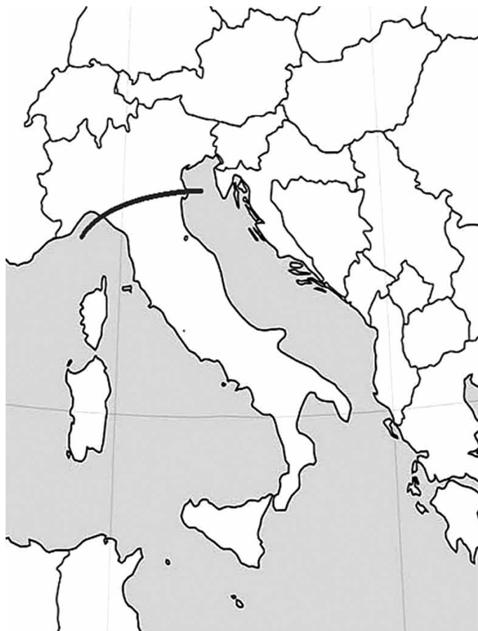
| Linia La Spezia – Rimini