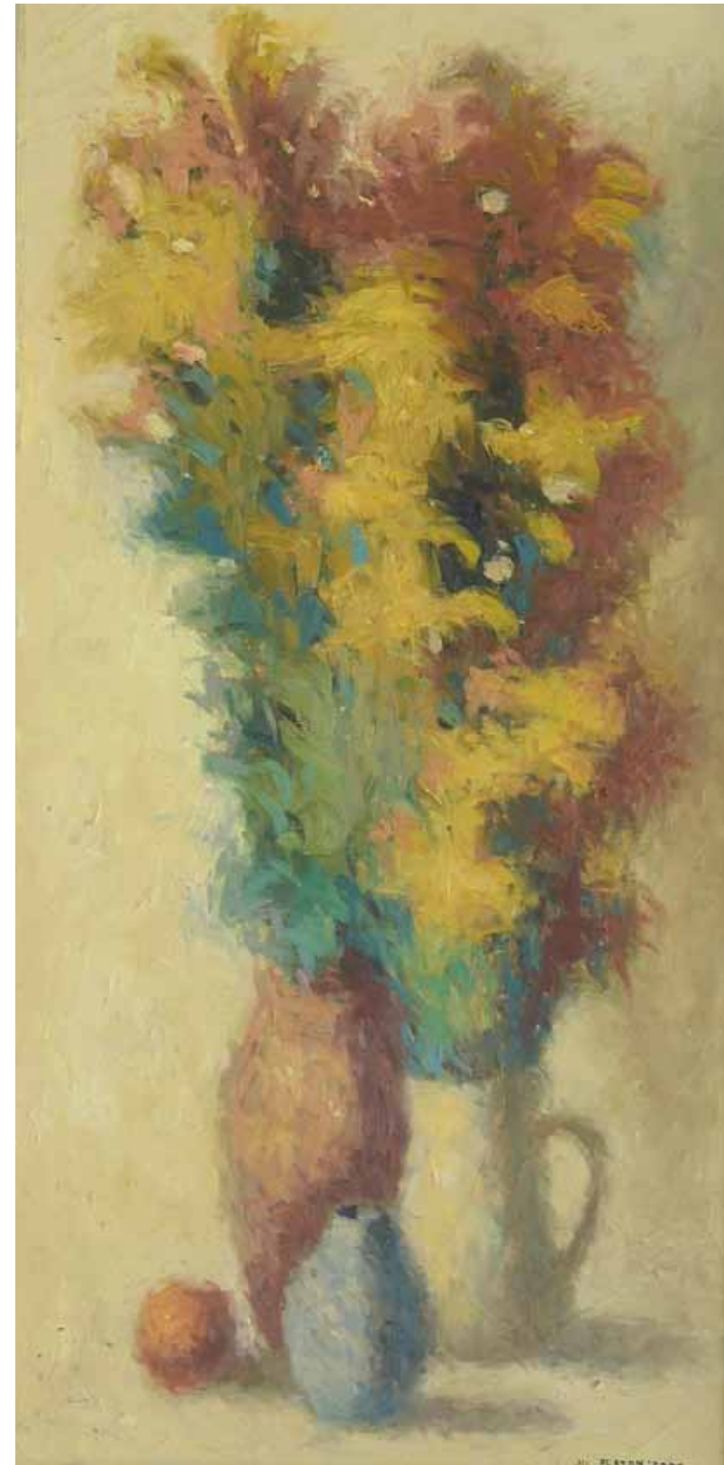
Natura statica II , 200 x 300 cm, ulei, pânză, 1986