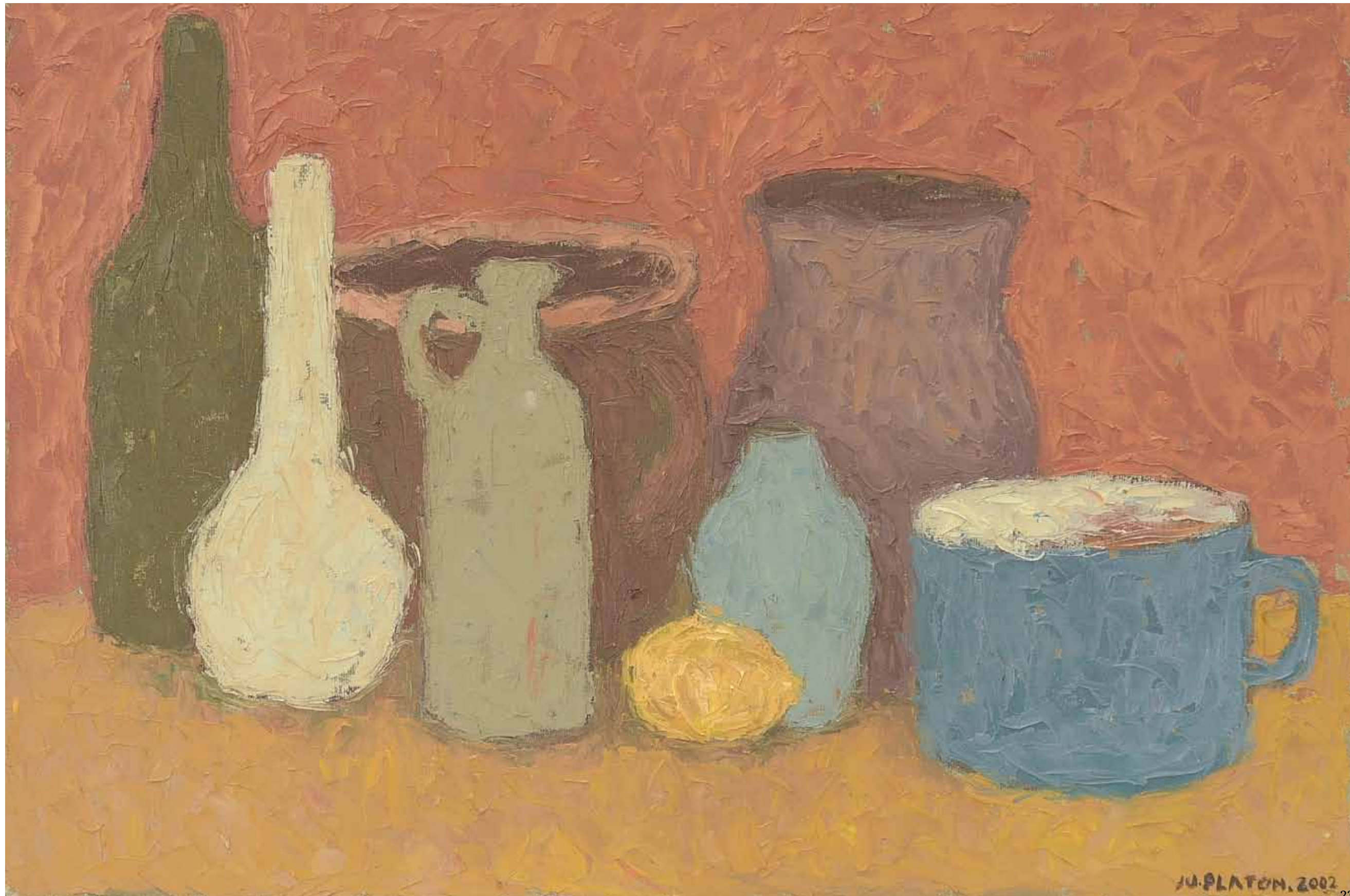
Natură statică, 110 x 90 cm, ulei, pânză, 2010