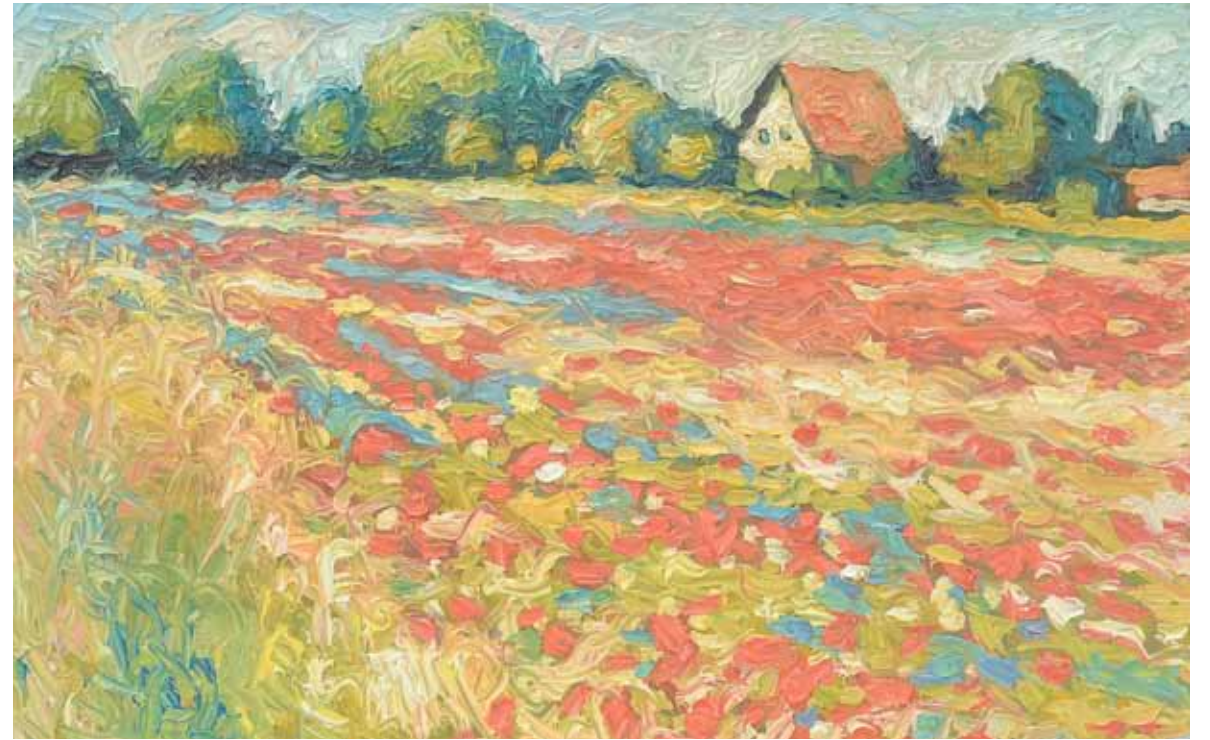
Peisaj III , 110 x 90 cm, ulei, pânză, 2010