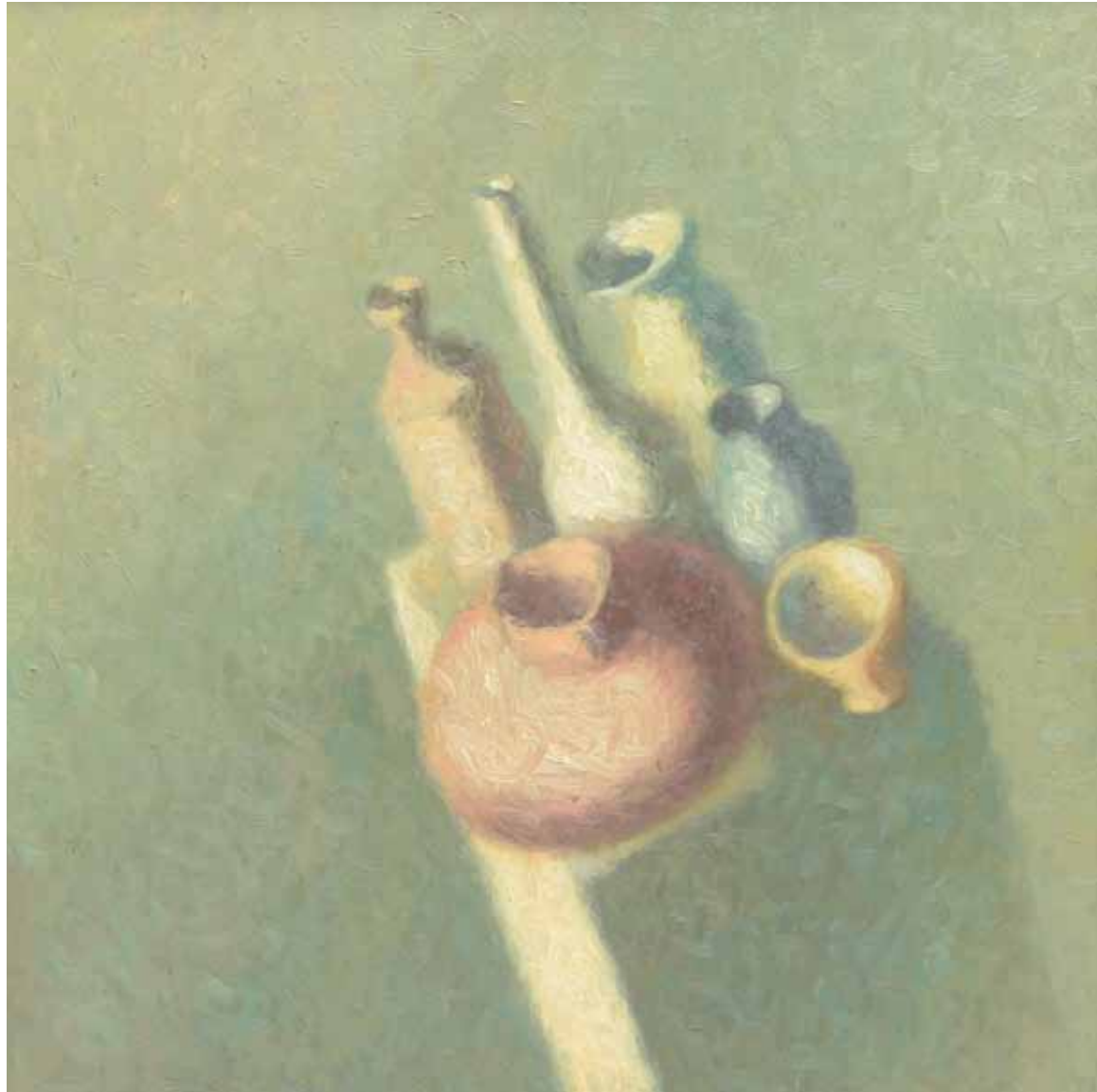
Natura statica , 200 x 300 cm, ulei, pânză, 1986