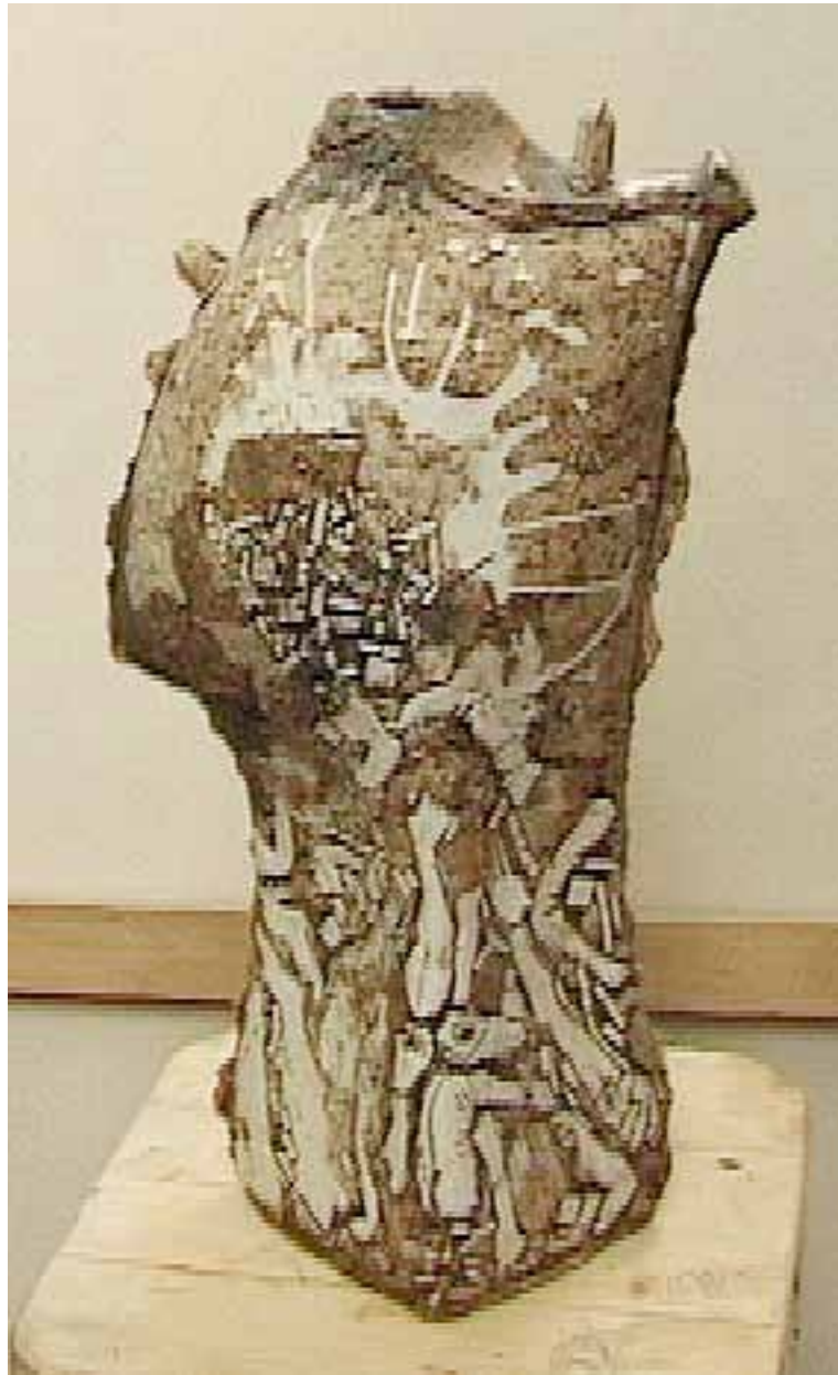
Tors , 60 x 80 cm, ceramică, 2015