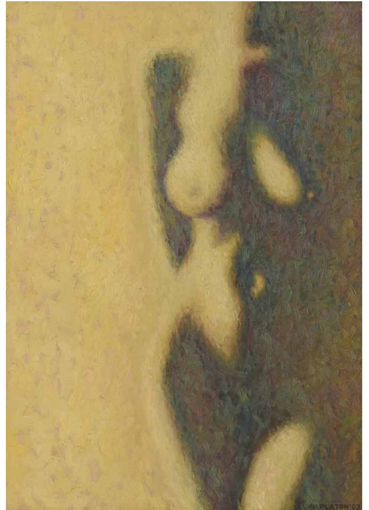
Nud , 200 x 50 cm, ulei, pânză, 1986