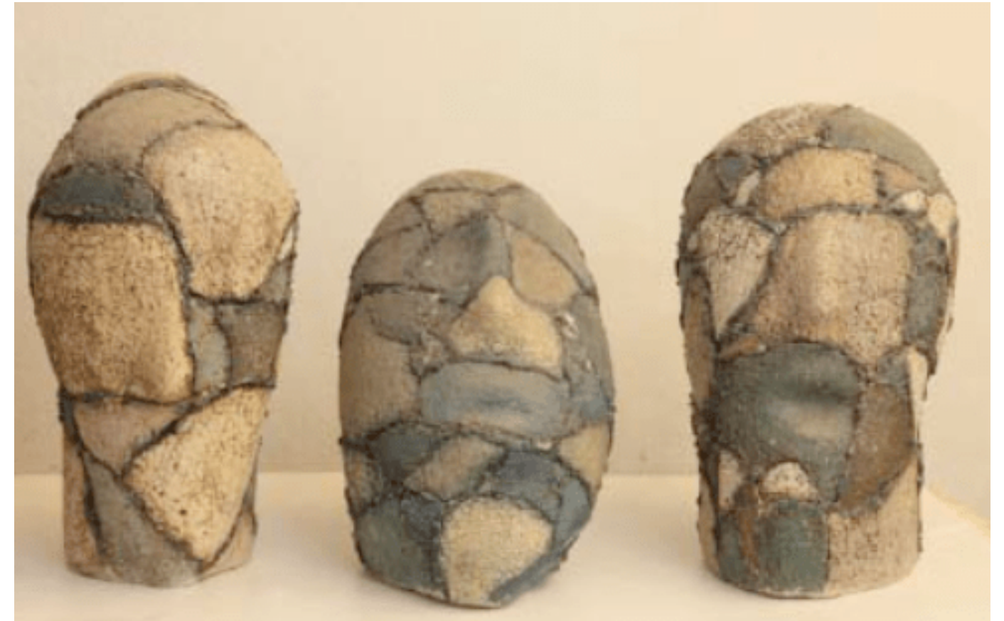
Trei , 60 x 80 cm, ceramică, 2015