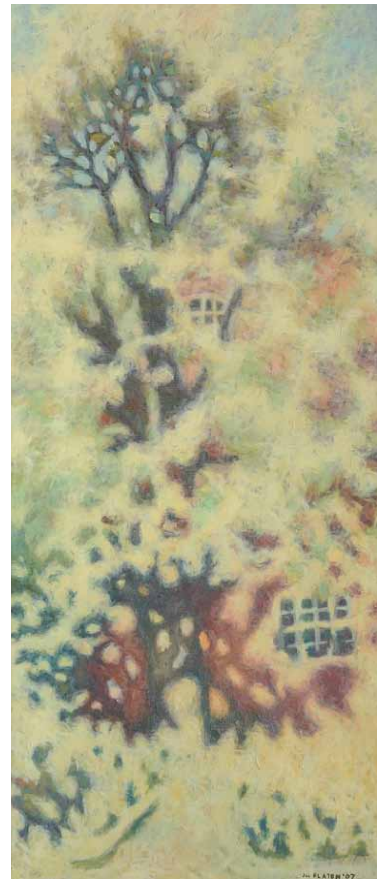
Peisaj , 80 x 60 cm, ulei, pânză, 2015