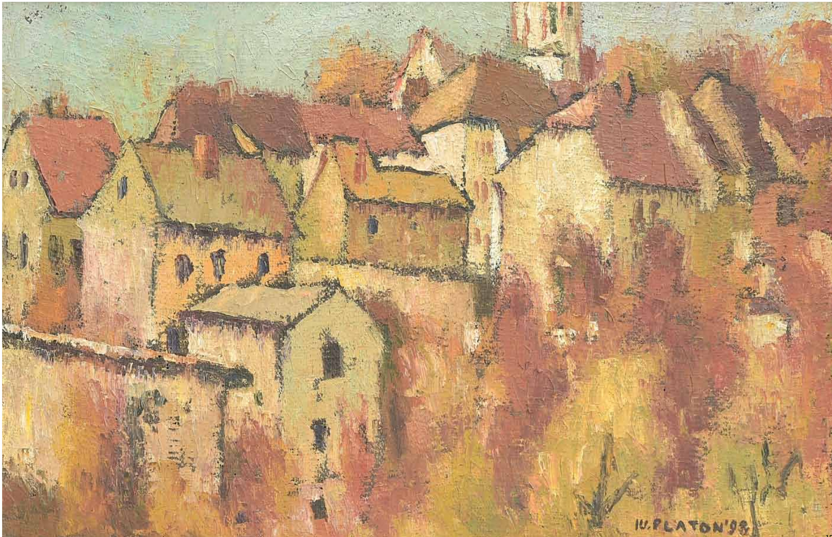
Peisaj , 40 x 60 cm, ulei, pânză 1984