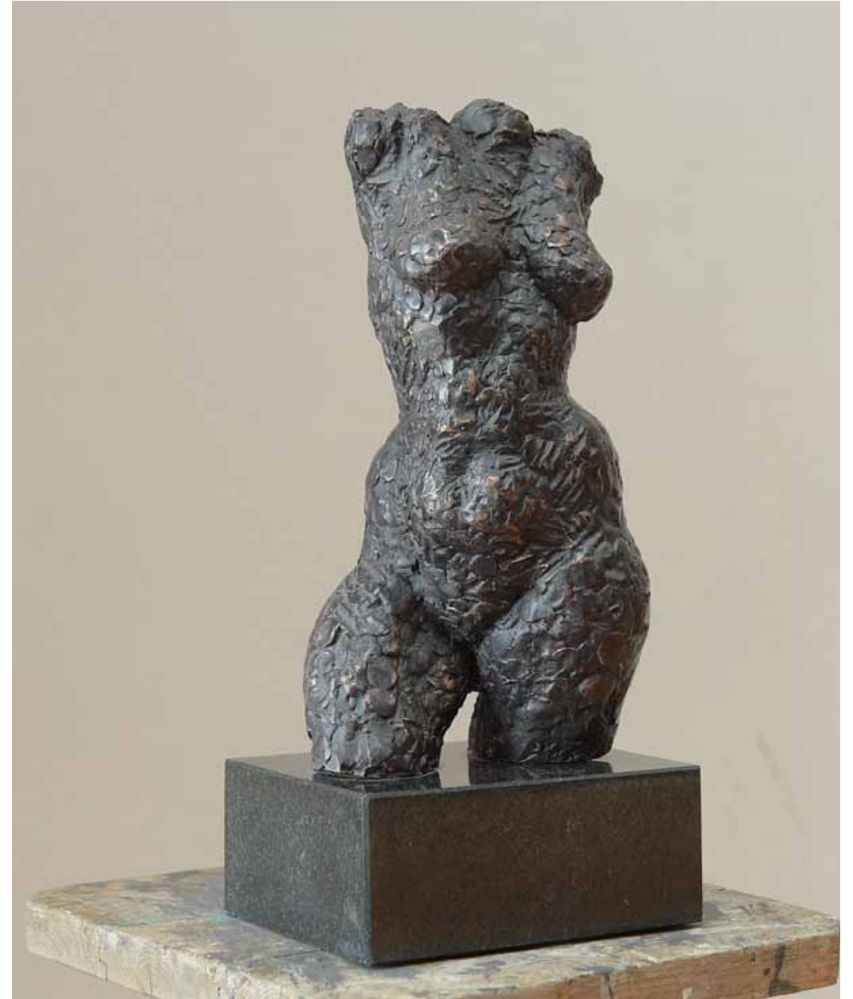
Tors II , 60 x 80 cm, bronz, 2015